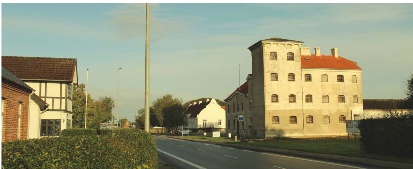
Kulturmiljøer i Hedensted Kommune